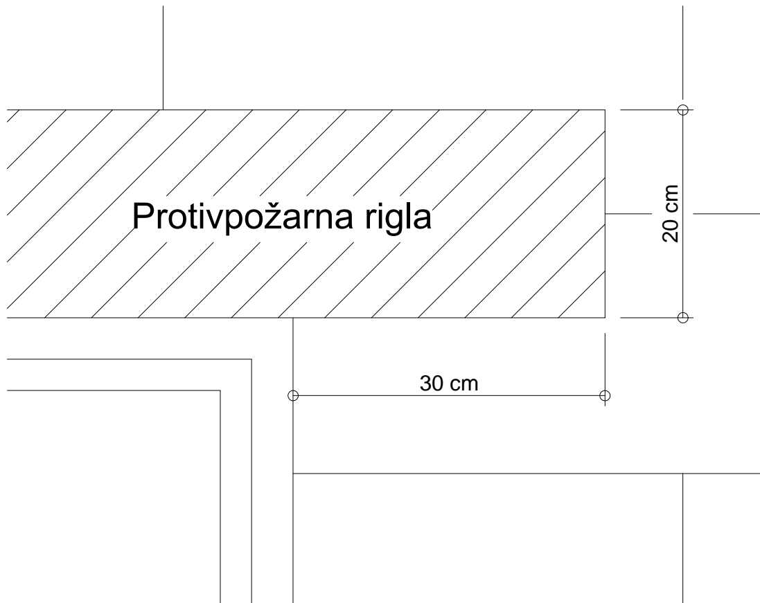
a) Zaštitna rigla u visini natprozornika